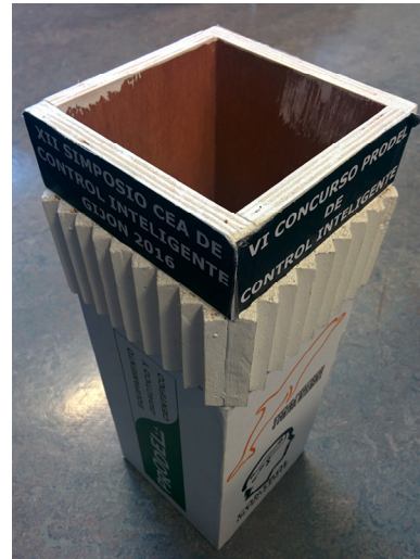
Figura 2: a) Detalle de la zona estriada. b ) Obstáculo.

Los círculos de color (C1, C2 y C3) tendrán un diámetro K y se realizarán con cartulina de la marca CANSON IRIS VIVALDI y referencias de colores 20 Sky blue código de barras 3148950402325 (RGB: 126/192/238), 29 Bright Green código de barras 3148950402387 (RGB: 50/205/50) y 14 Tomato código de barras 3148950402271 (RGB: 250/52/25). Las acciones a realizar en cada uno de los topos de color están especificadas en el cuadro de colores y acciones. Los círculos perimetrales (P) a los topos de colores son de diámetro interno L y diámetro externo M. Estos círculos perimetrales se crearán con cartulina de color 20 Sky blue, 29 Bright Green y 14 Tomato. Se permitirá a los equipos hacer algunas pruebas previas al concurso sobre la pista, por ejemplo para calibrar los sensores correctamente.