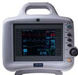
(a) Dash 2000, GE MS

Un monitor médico es un equipo de uso hospitalario destinado a la adquisición de información de parámetros biológicos de un paciente, de carácter gráfico, como electrocardiograma ECG, curva de saturación parcial de oxígeno SpO 2 , presión arterial invasiva, curva respiratoria y de carácter numérico como la presión arterial, saturación parcial de oxígeno, frecuencia cardíaca y temperatura. El monitor médico dispone de una serie de sensores que conectados al paciente recogen la información del mismo y mediante un sistema de adquisición de datos dicha información es digitalizada, ofreciendo la posibilidad de presentarla en la propia pantalla del monitor y de transmitirla a otros sistemas externos, opción muy útil cuando se supervisa un conjunto de enfermos desde un único puesto.