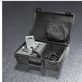
(b) DS 6100, DNI Nevada